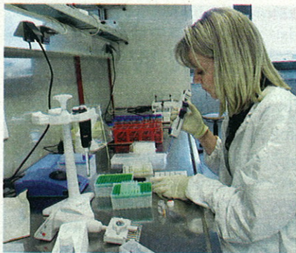
Im Labor: kleine Standorte geschlossen.